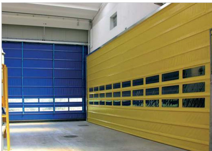
Poikittaisvahvikkeet lisäävät oviverhon tuulensietokykyä.