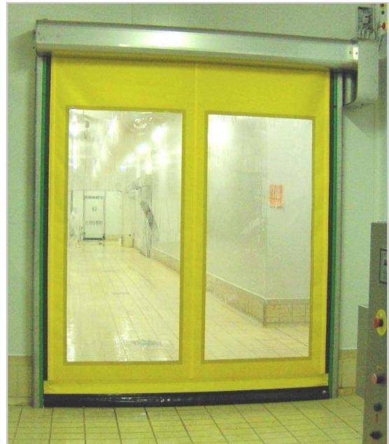
Suojakotelot ja johteet vakiona ruostumatonta terästä (AISI 441)

Painonappi-, vetokytin-, tutka-, lattialanka-, radio-ohjaus tai jokin muu asiakassovellus.