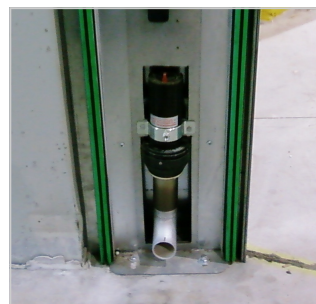
Oviverhojen väliin voidaan johtaa ilmaa.