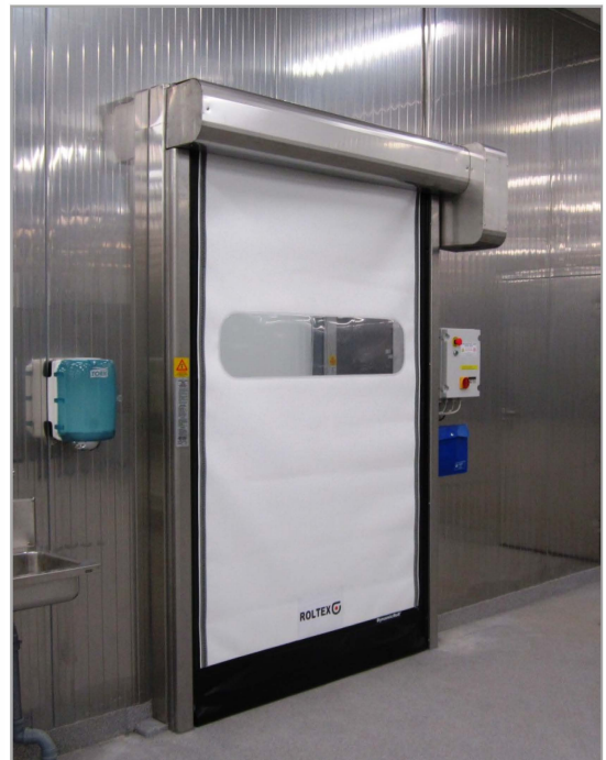
Valkoinen Elastar oviverho täyttää FDA vaatimukset