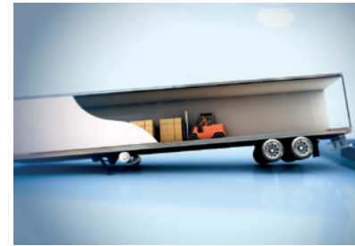
Perävaunun tukijalkojen rikkoutuminen.