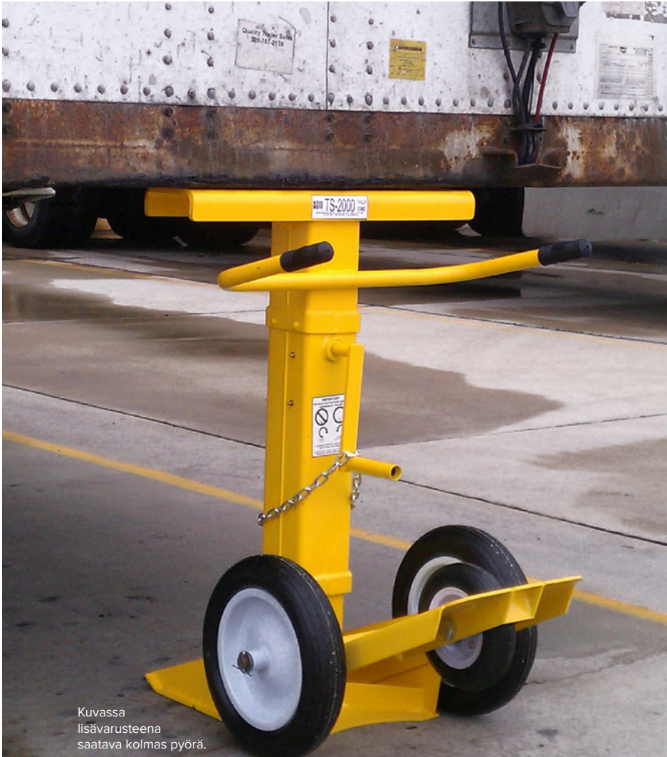
Kuvassa lisävarusteena saatava kolmas pyörä.

Minimoi lastauslaiturionnettomuudet perävaunua lastattaessa ja lastia purettaessa.